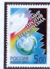
Рисунок И. Тыртычного. Офсет на мелованной бумаге. Зубцовка гребенчатая 12 1/2 : 12. Размер марки 28 x 40 мм. Марка многоцветная.

2002. Январь, 30. Мир против терроризма.