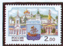
Рисунок А. Плетнева. Офсет на мелованной бумаге. Зубцовка гребенчатая 12 : 12 1/2. Размер марки 40 x 28 мм. Марка многоцветная. ©