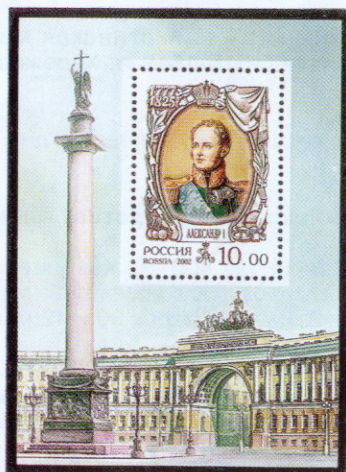
Рисунок Л.Зайцева. Гравер С. Кузнецов. Офсет с металлографией на мелованной бумаге. Зубцовка рамочная 12 : 12 1/2 . Размер блока 65 x 90 мм. Размер марки в блоке 30 x 42 мм. Блок многоцветный .