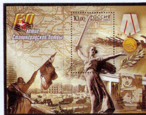
Рисунок А. Московца. Офсет на мелованной бумаге. Зубцовка рамочная 12 : 12 1/2. Размер блока 100 x 75 мм. Размер марки в блоке 30 x 42 мм. Блок многоцветный.

РОССИЯ 60-летие Сталинградской битвы 04-10-2002 ПОЧТАМТ-ВР