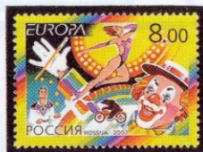
Рисунок В. Бельтюкова. Офсет на мелованной бумаге. Зубцовка гребенчатая 12 1/2 : 12. Размер марки 42 x 30 мм. Марка многоцветная.

2002. Май, 9. Цирк. Выпуск по программе «Европа».